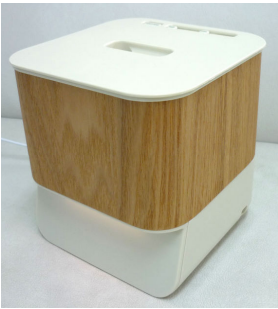
ウッドナチュラルFSD-01WN